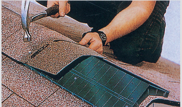
용마루 벤트(Plastic Ridge Vent) : 길이 1219mm × 30.48cm