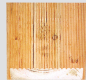
Red Pine 방부목